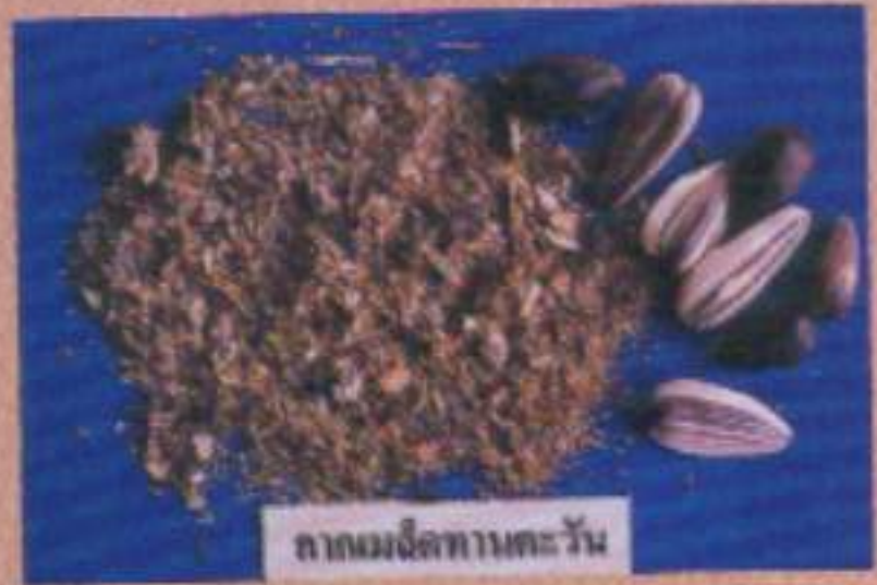
ถั่วเมล็ดทานตะวัน