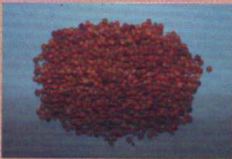
เมล็ดถั่วมะแฮะ