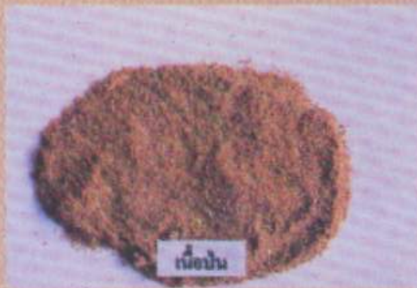
เนื้อป่น