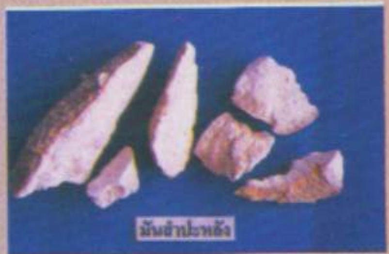
มันสำปะหลัง