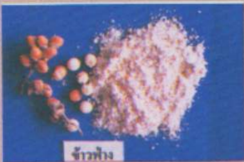
ข้าวฟ่าง