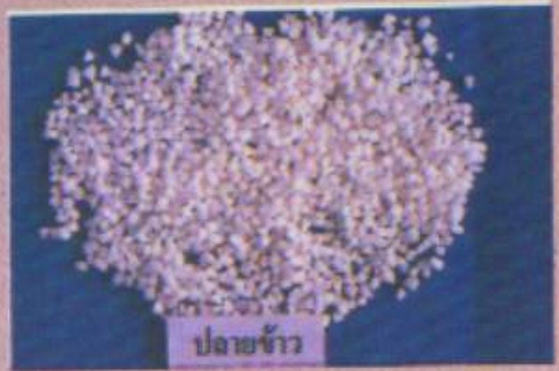
ปลายข้าว