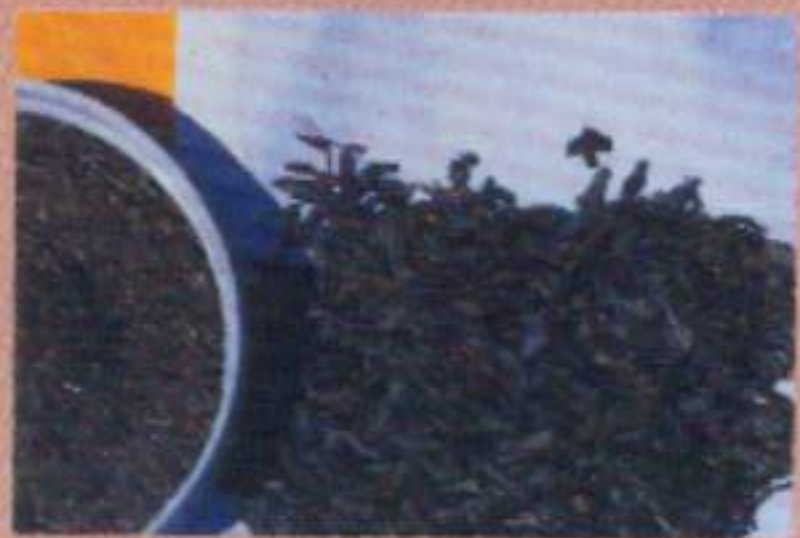
โบกระถิน