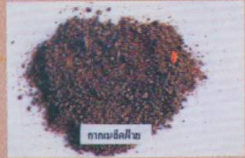
กากเมล็ดฝ้าย