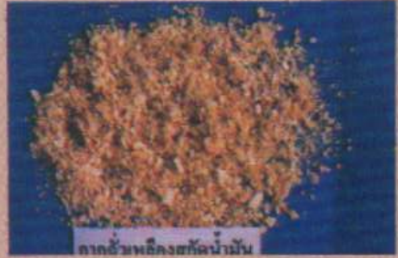
กากถั่วเหลืองสกัดน้ำมัน