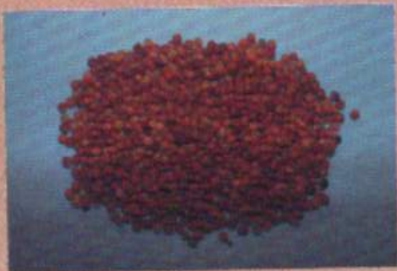
เมล็ดถั่วมะแฮะ