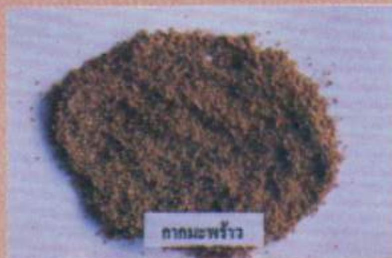
กากมะพร้าว