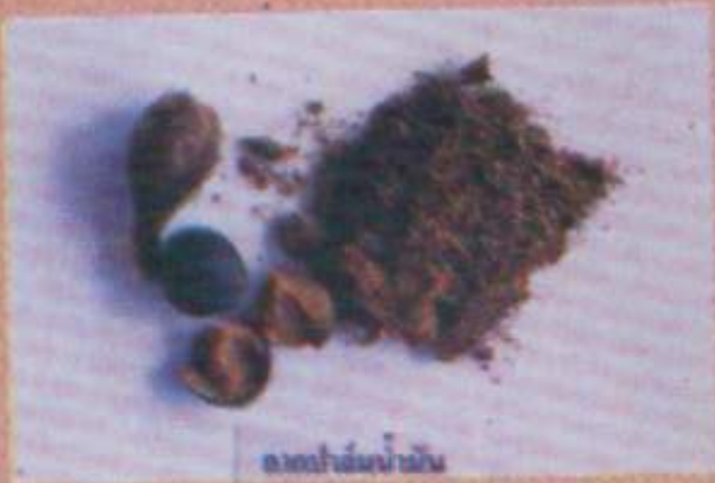
ถั่วปาล์มน้ำมัน