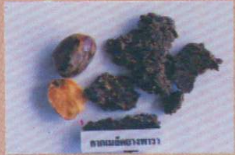
กากเมล็ดถั่วเขียว