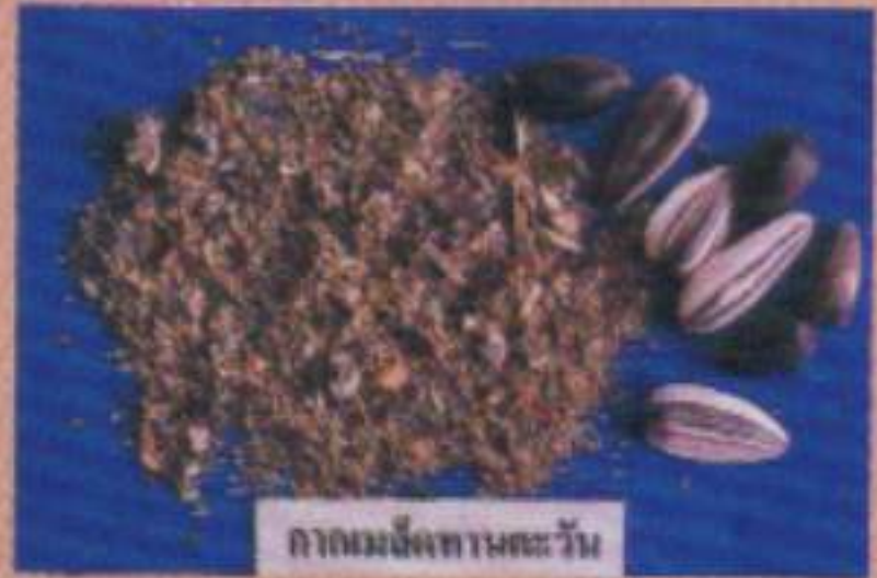
กากเมล็ดทานตะวัน