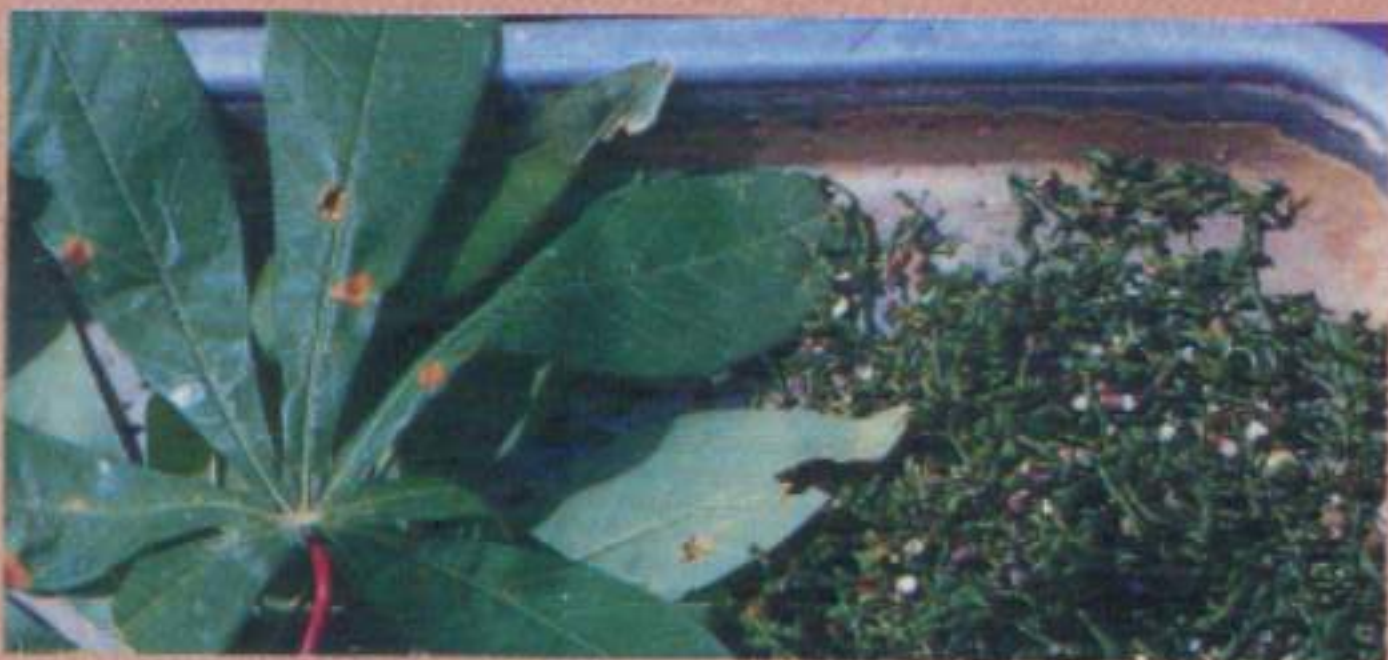
โบมันสำปะหลัง