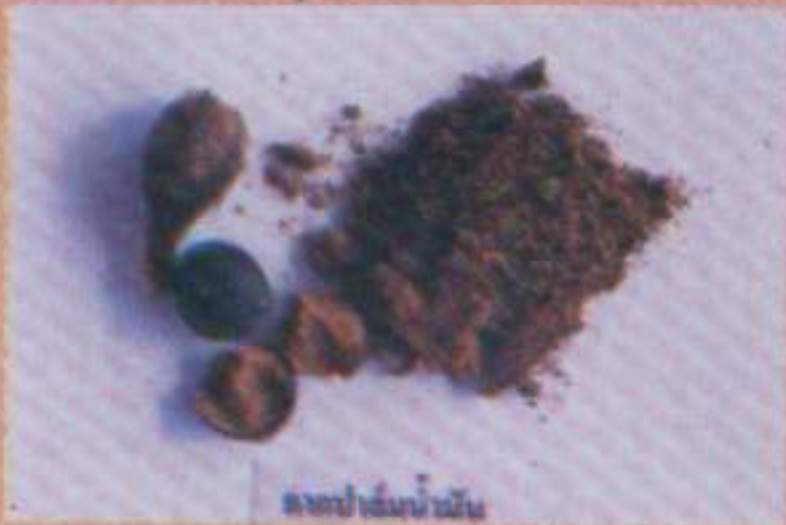
ดงคอปาล์มน้ำมัน