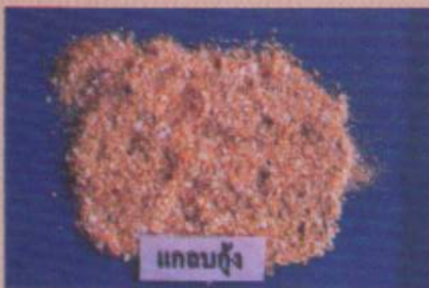
แกลบคั่ว