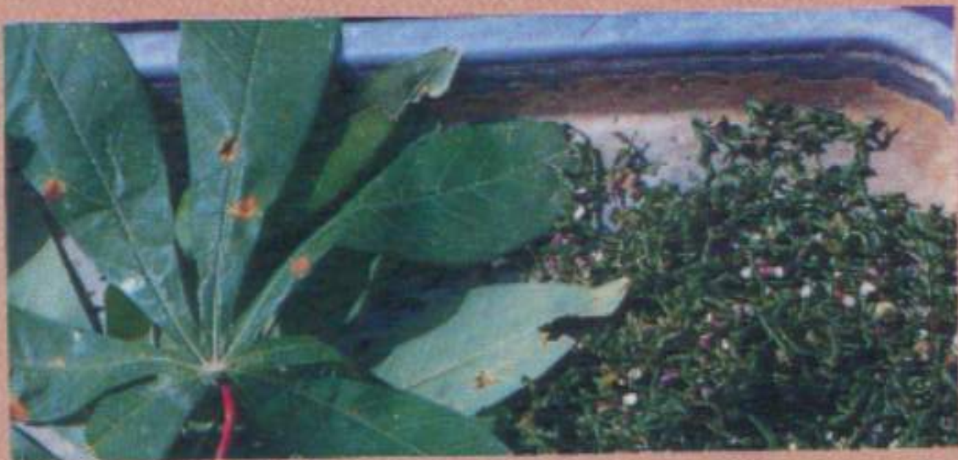
โบมันสำปะหลัง