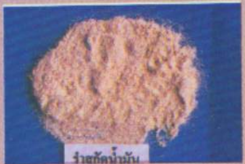
รำสกัดน้ำมัน