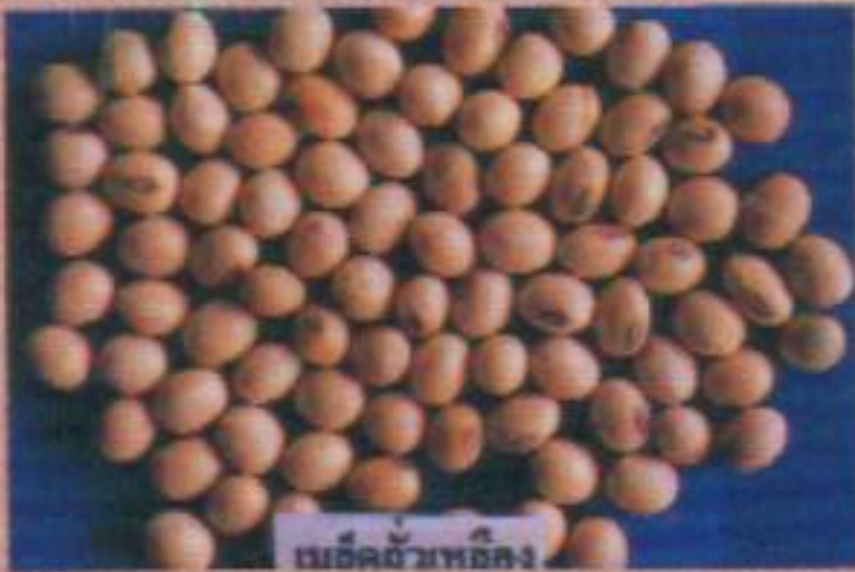
เมล็ดถั่วเหลือง