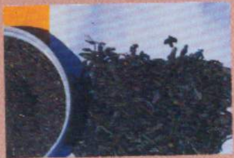
โบกระถิน