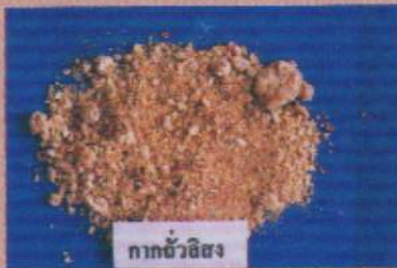
กากถั่วลิสง