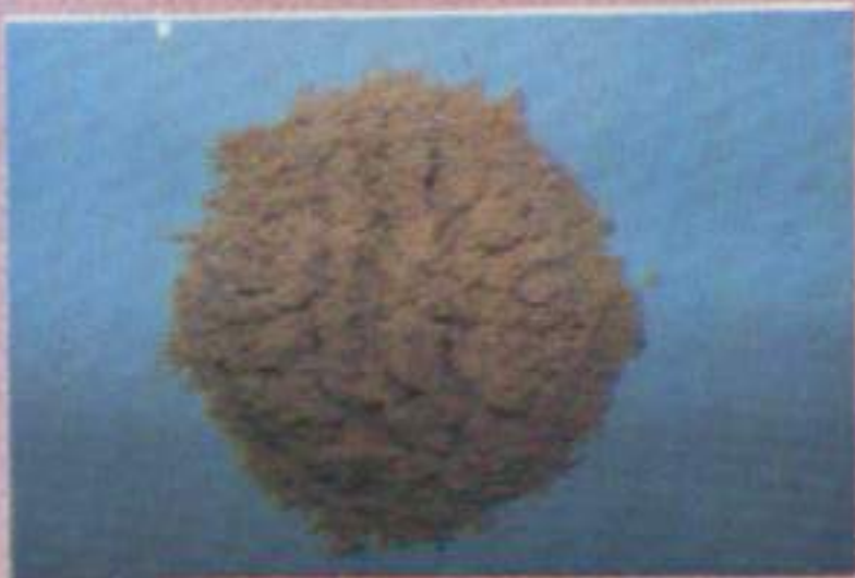
รำละเอียด