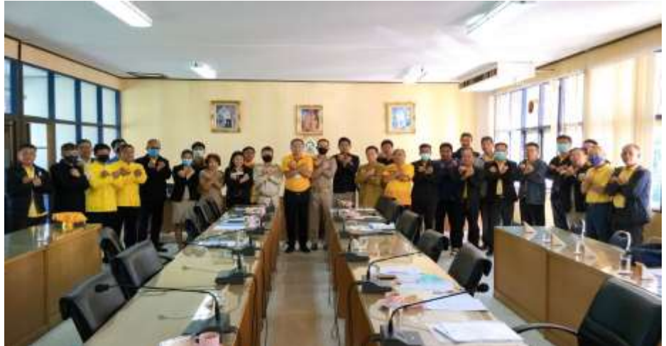
บุคลากรร่วมแสดงเจตนารมณ์และความมุ่งมั่นในการต่อต้านการทุจริตคอร์รัปชัน

๓. จัดกิจกรรมที่มี การแสดงออกเชิง สัญลักษณ์ในการ ต่อต้าน การทุจริตคอร์รัปชัน