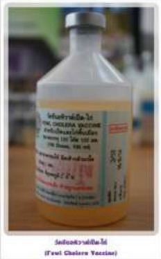
วัคซีนอหิวาต์เปิด-ไก่ (Fowl Cholera Vaccine)