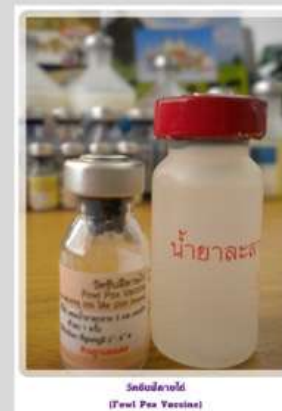
วัคซีนฟิดาซ (Fowl Pox Vaccine)